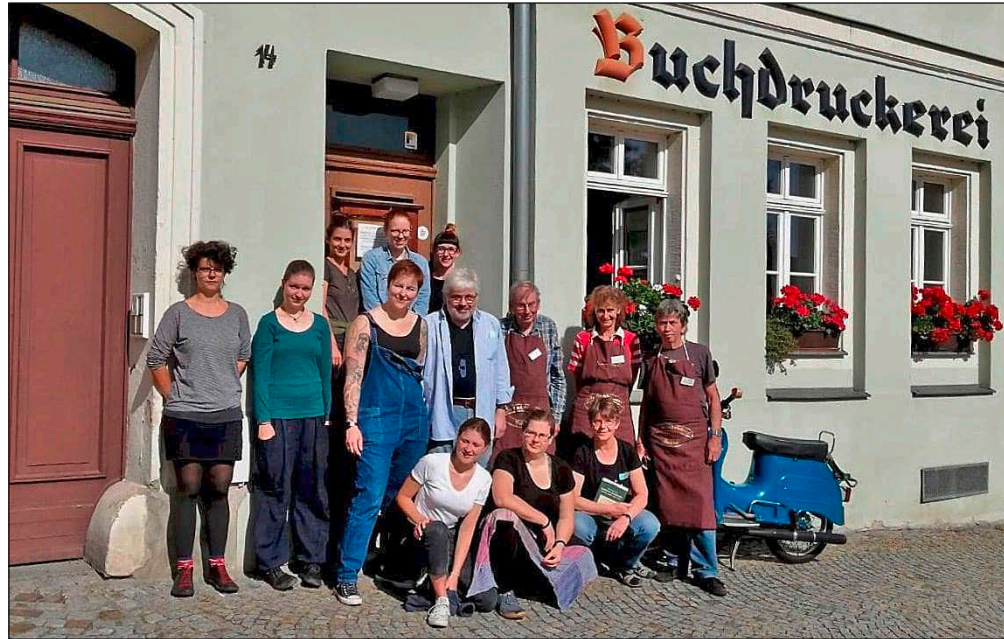
ALUMNI-TREFFEN DER STIPENDIATINNEN 2020 IN DOHNA

Um das Kulturerbe der handwerklichen Druckkunst lebendig zu halten, braucht es fachkundigen Nachwuchs: Junge Menschen, die in den traditionellen Berufen des Schriftgießers, Setzers und Druckers so ausgebildet sind, dass sie ihr Wissen kompetent einsetzen und nach einigen Lehr- und Wanderjahren sogar weitergeben können. Darin sieht der VEREIN FÜR DIE SCHWARZE KUNST seine